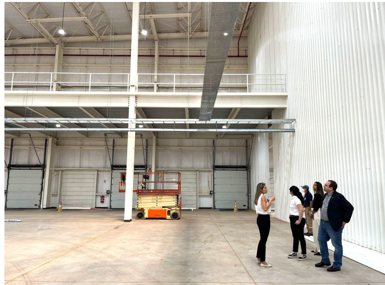
Reconocimiento de una de las naves de producción que ocupará DIPRO en el Parque Industrial Guarambaré