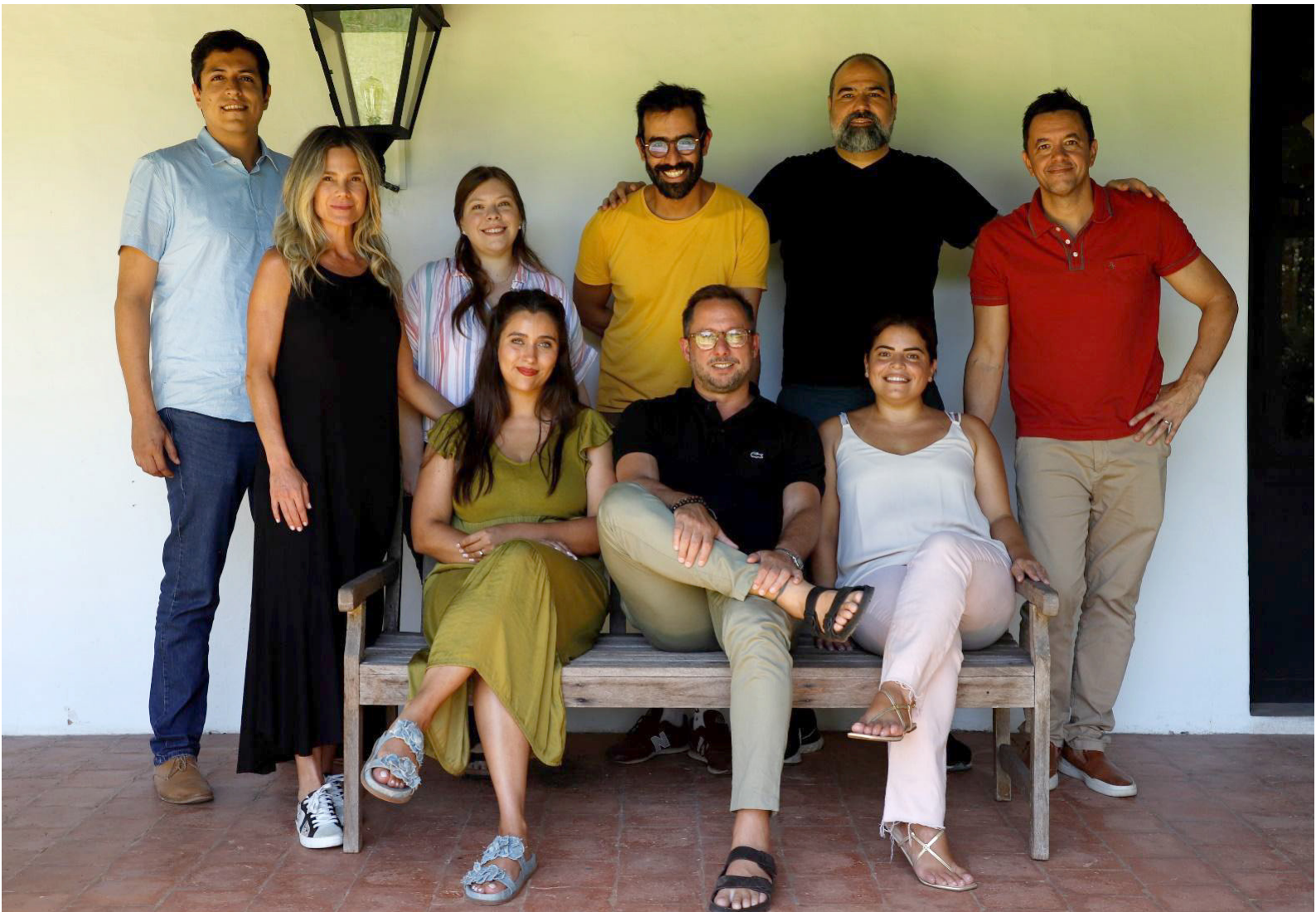
Parte de la gerencia de ONIRIA/TBWA; Play Content Studio y Brandon

Allí, se encuentran actualmente las oficinas de tres empresas pertenecientes al grupo ICON: ONIRIA/TBWA; Brandon y Play Content Studio; que forman parte de la plataforma sectorial de Industrias Creativas y Servicios de REDIEX.