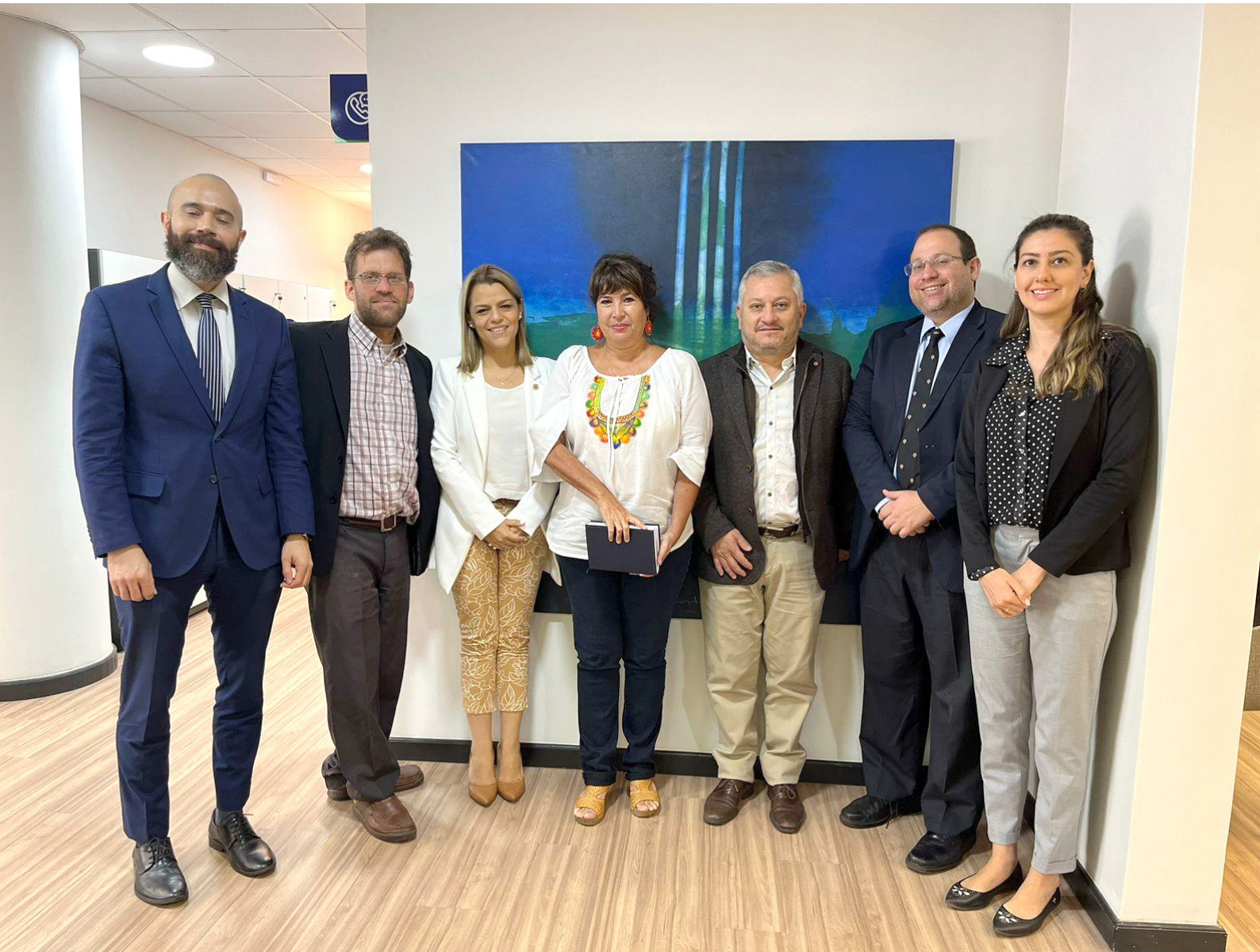
La reunión se realizó en las oficinas de REDIEX