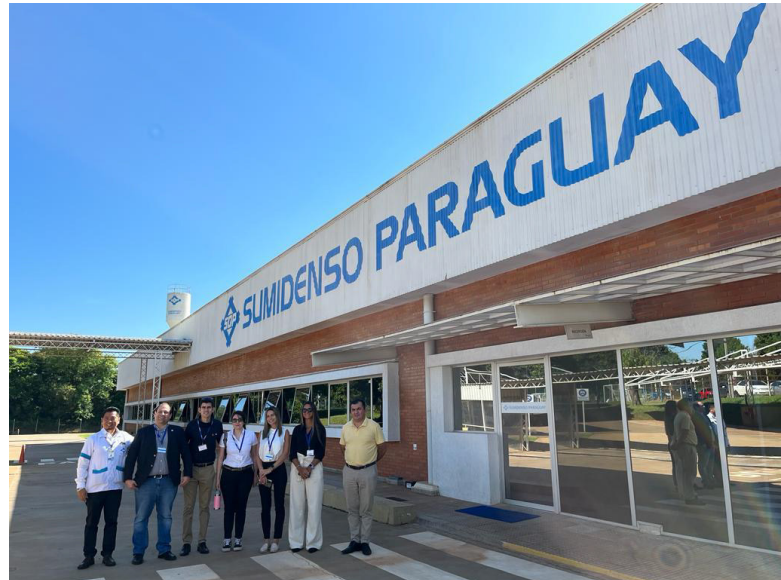
El equipo de REDIEX junto a directivos de SUMIDENSO PARAGUAY y ALMASOL/GICAL