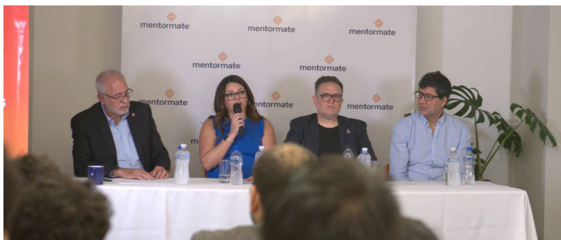
Acto de presentación de Mentormate Paraguay

La misma es parte de la plataforma sectorial de industrias creativas y servicios de REDIEX y es beneficiaria del proyecto 3865 de “Apoyo a las Empresas Exportadoras Paraguayas”.