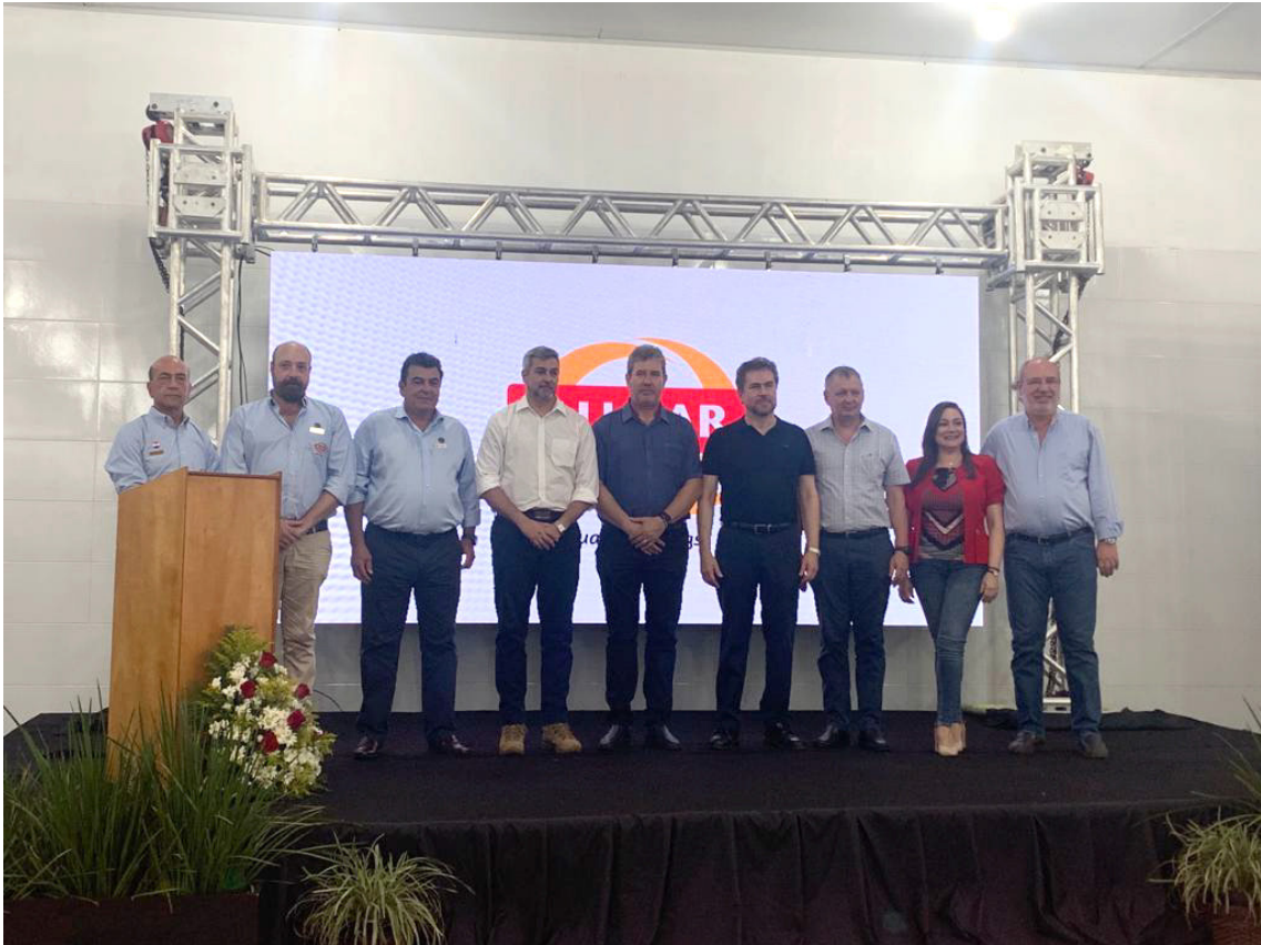
Inauguración ALL PAR CASINGS en Naranjal

Frigorífico Concepción realizó un acto protocolar en el cual inauguró oficialmente la planta industrial All Par Casings S.A. en la localidad de Naranjal, Alto Paraná. El grupo empresarial es parte de la plataforma sectorial de carnes y derivados de REDIEX.