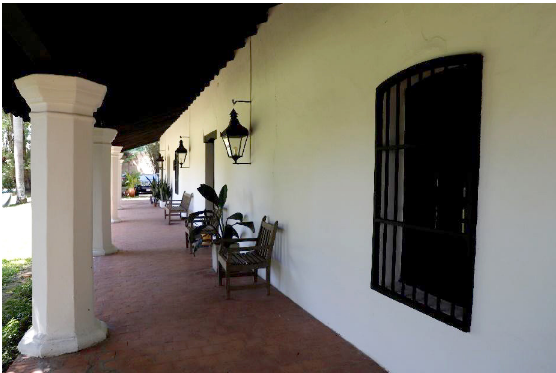
Sus oficinas se albergan en el Caserón de Ubalda