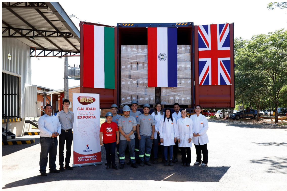
Parte del plantel de IRIS con el camión repleto de productos que llegarán a Reino Unido

La empresa de domisanitarios, insecticidas y cosméticos IRIS PARAGUAY amplía su mercado de exportación en Europa, sumando un cliente en Reino Unido.