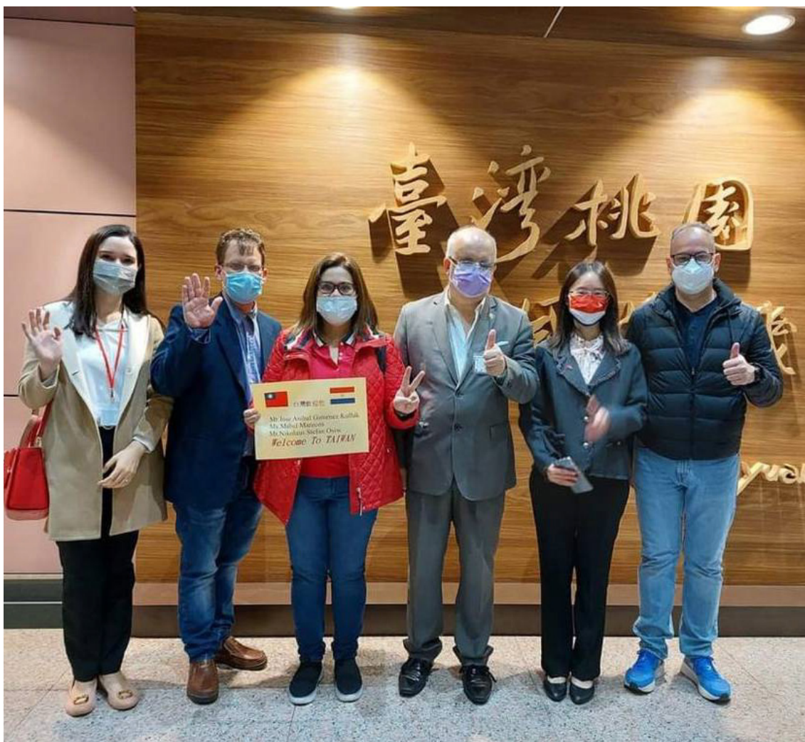
Los profesionales fueron recibidos por miembros de la embajada paraguaya en Taiwán

“Forjando conexiones 2022”: Semanas atrás, una comitiva de profesionales paraguayos pertenecientes a diversas instituciones públicas fue invitada por la República de China (Taiwán) a capacitarse en materia de cooperación económica y comercial, con el objetivo responder a los cambios en la situación geopolítica, fortalecer la oferta global y promover la cooperación económica y comercial entre las naciones.