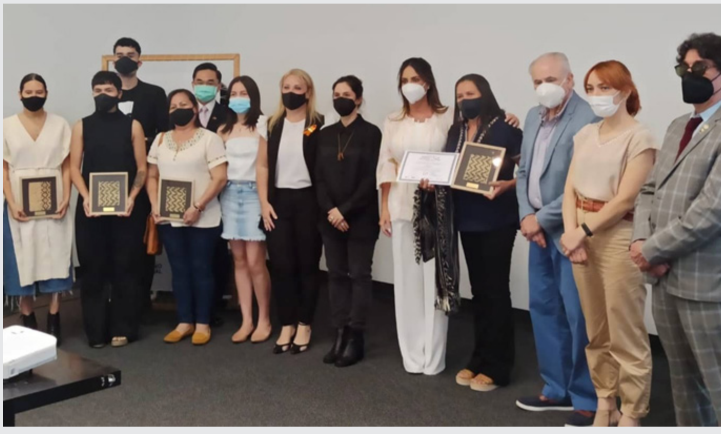
Equipo JOVAI, ganador del Concurso.

El objetivo de la competencia era salvaguardar las técnicas de artesanía populares y ancestrales del Paraguay a través del co-diseño, entre el diseñador y el artesano local para el fortalecimiento y desarrollo de las comunidades artesanas.