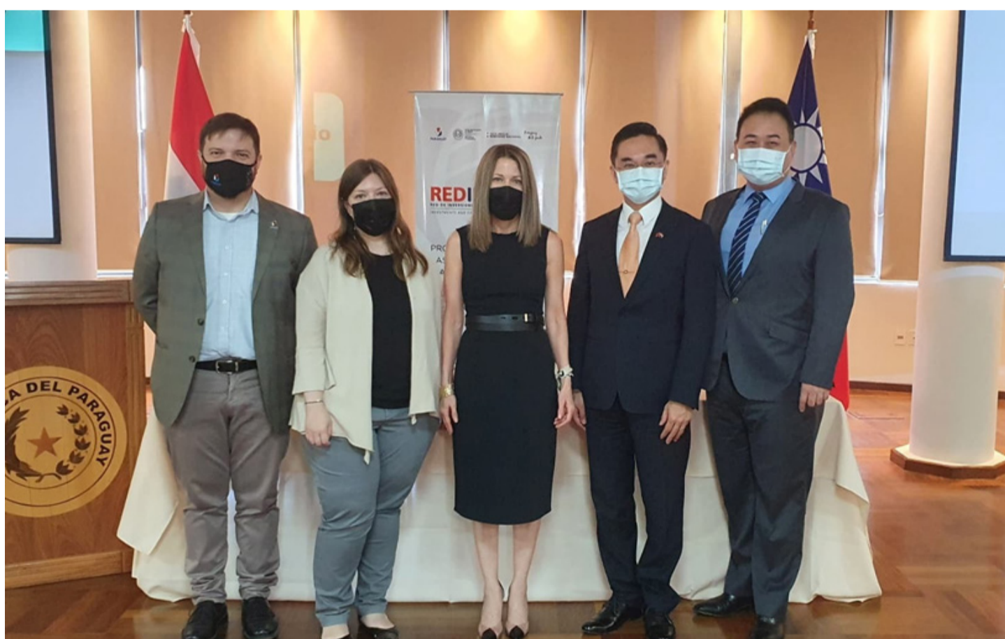
Autoridades de REDIEX y la Embajada de Taiwán presentaron la plataforma online

“Paraguay Mobile Game Development Tutorial Website” es una plataforma de desarrollo de videojuegos móviles (para smartphones y tabletas) creada por Taiwán. La misma fue presentada en conjunto con #REDIEX en Salón Auditorio del Ministerio de Industria y Comercio, con presencia de empresarios del rubro del desarrollo gamer, instituciones educativas y la prensa.