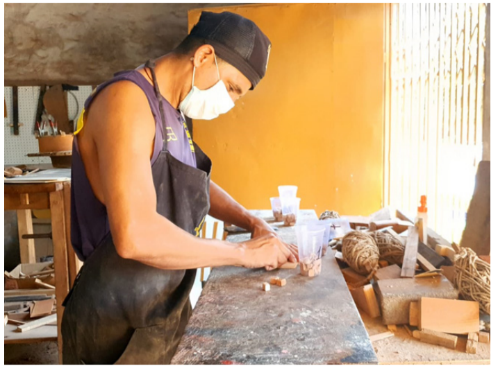
El trabajo de fabricación es minucioso y requiere de una gran pericia

rosa, guayubira, tatara, timbo, petereby y lapacho. Mientras que las maderas importadas son Palo Santo de la India, Ébano, Wenge, Nogal, Ciprés, Arce, Pino Alemán y Pino Canadiense.