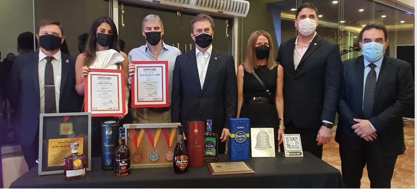
Fortín S.A. recibió licencias de Marca País para la Caña Fortín y La Ruta de la Caña

La Red de Inversiones y Exportaciones (REDIEX) del Ministerio de Industria y Comercio hizo la entrega de los certificados de Licencia de Marca País a la marca “CAÑA FORTÍN” y al circuito turístico “LA RUTA DE LA CAÑA” de la empresa Fortín S.A.