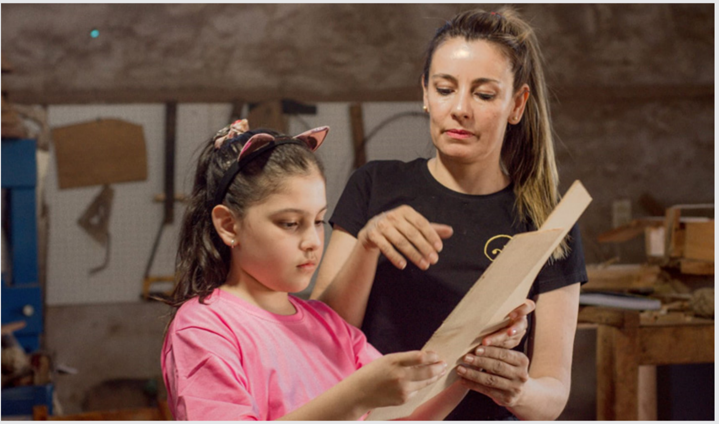
La Escuela de Lutería recibe alumnos y alumnas de todas las edades

“Con la creación de la escuela quisimos mostrar que este oficio no es simplemente ser un mbaraka apoha, como se dice. Un producto bueno requiere de estudios de física, calorimetría, acústica. Saber lijar la madera, darle forma, hacer que una caja de resonancia suene lo más fuerte posible sin perder la calidad del sonido. Todo esto les enseñamos en la Escuela, ellos mismos ya no dicen más soy mbaraka apoha, de acá salen diciendo SOY LUTHIER” enfatizó Borja.