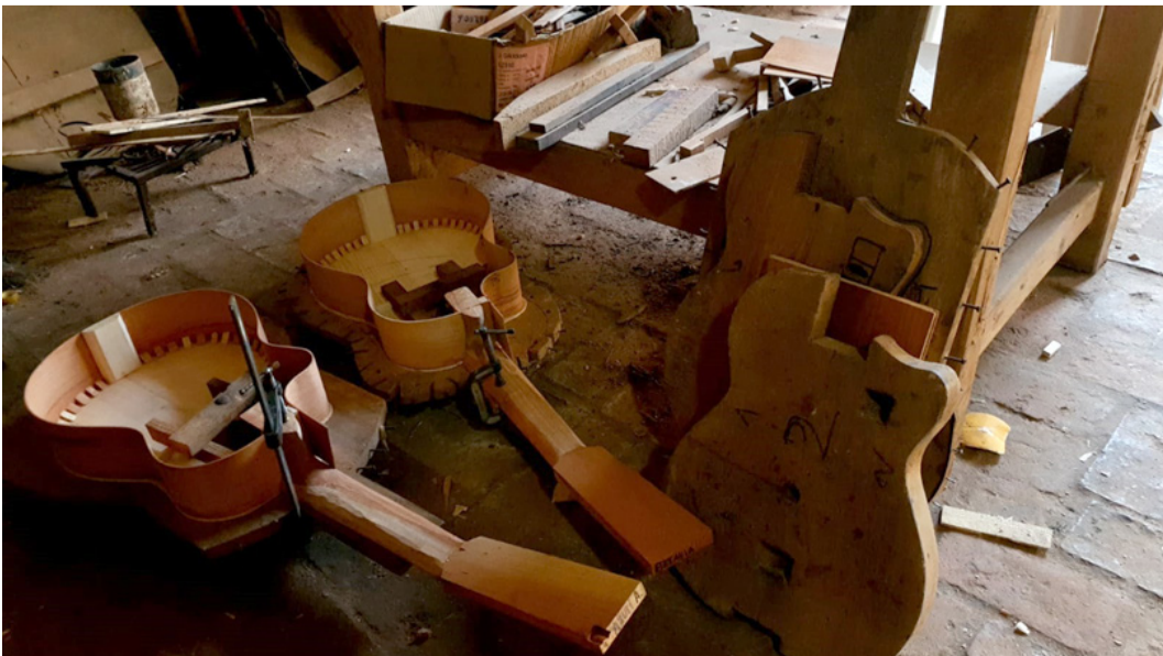
Para Don Borja, es posible entregar una guitarra terminada en seis días

En este momento, BORJA LUTHIERS se encuentra iniciando el proceso de REDIEX con un subproyecto de REDIEX, a ser ejecutado con fondos del Banco Interamericano de Desarrollo, para potenciar la marca a través del desarrollo de un sitio web enfocado al e-commerce y otras proyecciones, lideradas por Luz, a través de la Plataforma Sectorial de Industrias Forestales y Floricultura de REDIEX.