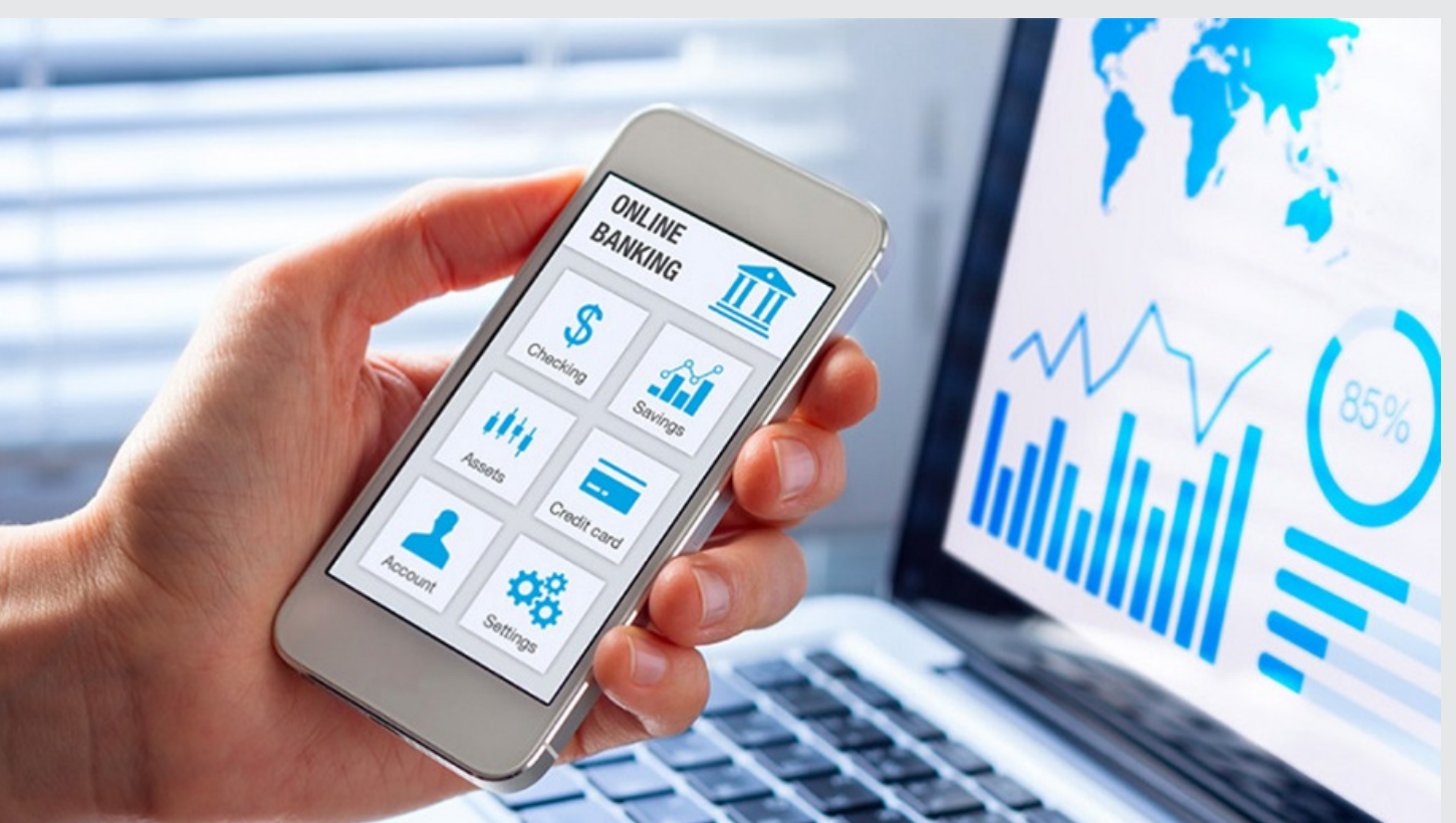
El SUACE se interconectará con la banca privada para que la información será compartida online. | Imagen referencial

El Observatorio del Clima de Negocios de REDIEX impulsó acciones para facilitar el proceso de Solicitud de Apertura de Cuentas Bancarias.