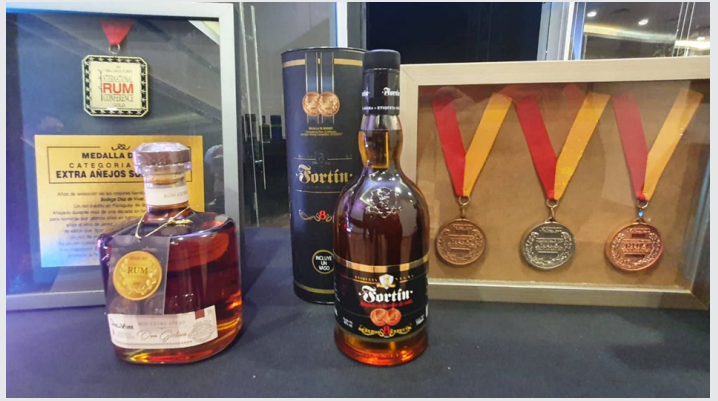
El Ron Paraguayo, considerado Premium, es aclamado en mercados locales e internacionales