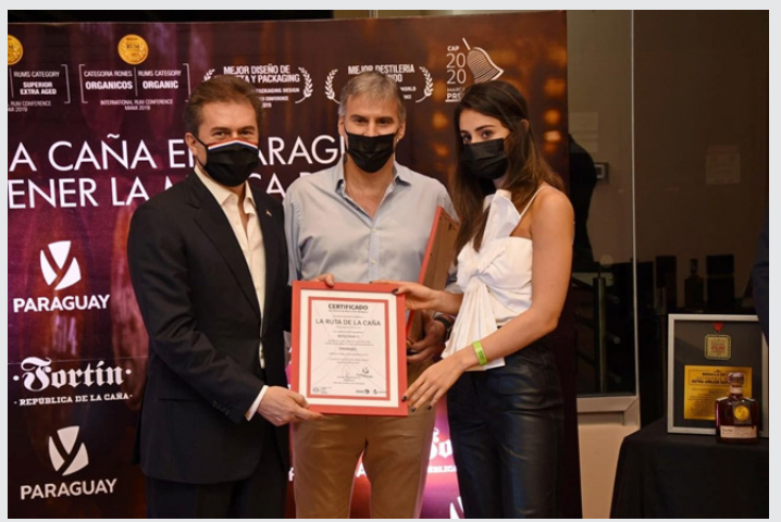
El circuito “La Ruta de la Caña” promueve el turismo en la ciudad de Piribebuy