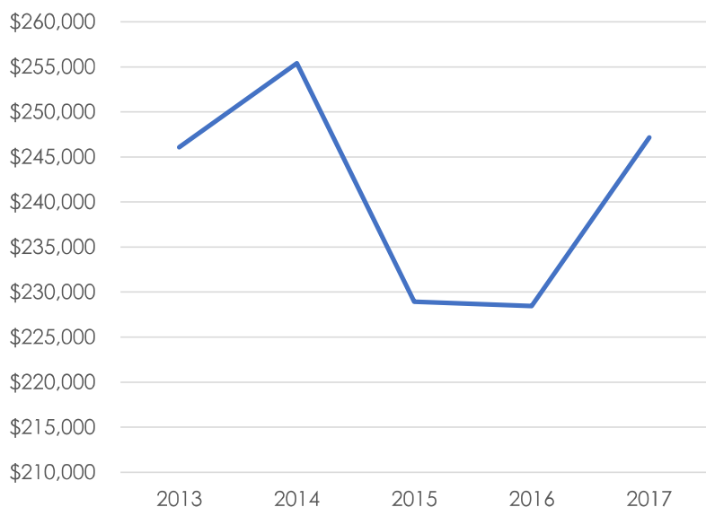
Valor de las exportaciones globales de productos forestales (millones $US)