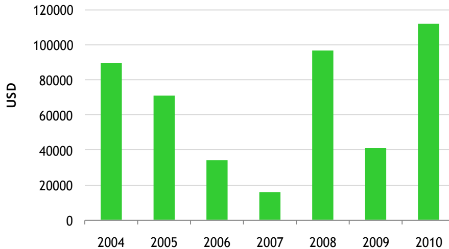
Exportaciones paraguayas de Vajilla de plástico (USD)