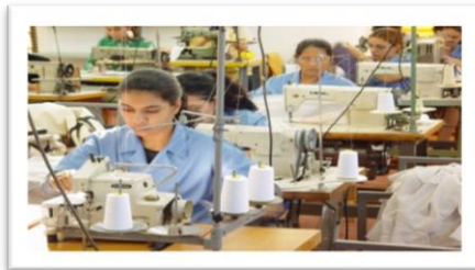
Textil - Confecciones