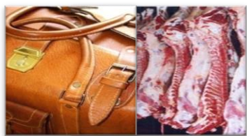
Carne y Cuero

EXPORTAR: acciones orientadas a la exportación