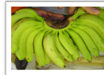
Frutas y Hortalizas